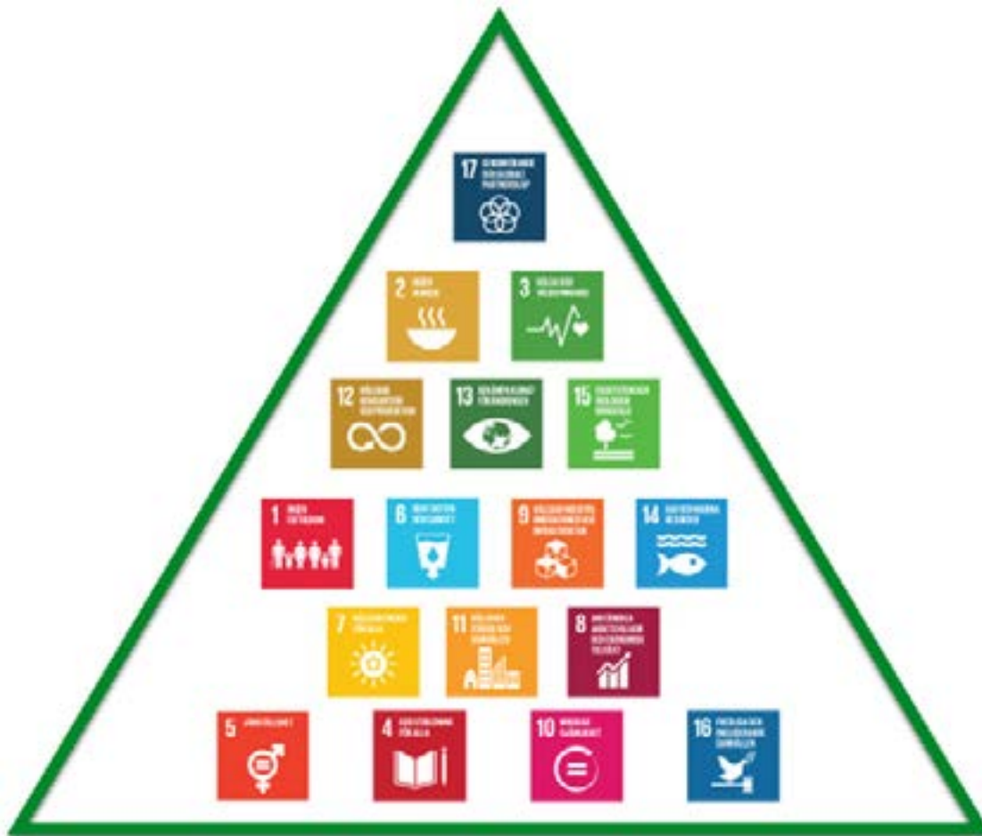
Figur 2. Djurhälsa och livsmedelssäkerhet är centrala för SVA:s arbete med Agenda 2030. Samverkan, utveckling och kommunikation är viktigt i allt SVA gör. Pyramiden visar SVA:s prioritering, med de viktigaste målen i toppen ur Rapport SVA Globala målen (14).

I strategin beskrivs det nationella målet för klimatanpassning - att utveckla ett långsiktigt hållbart och robust samhälle som aktivt möter ett förändrat klimat genom att minska sårbarheter och tillvara ta möjligheter. Det ingår även att uppnå målsättningarna för klimatanpassning i Parisavtalet (4) och i Agenda 2030 för hållbar utveckling (5). Dessa mål ska beaktas i politik, strategier och planering på nationell nivå, samt integreras i myndigheternas ordinarie verksamheter och ansvar. Klimatanpassningsarbetet bör bedrivas utifrån tio vägledande principer (1): hållbar utveckling, ömsesidighet, vetenskaplig grund, försiktighetsprincipen, integrering av anpassningsåtgärder, flexibilitet, hantering av osäkerhets- och riskfaktorer, tidsperspektiv och transparens.