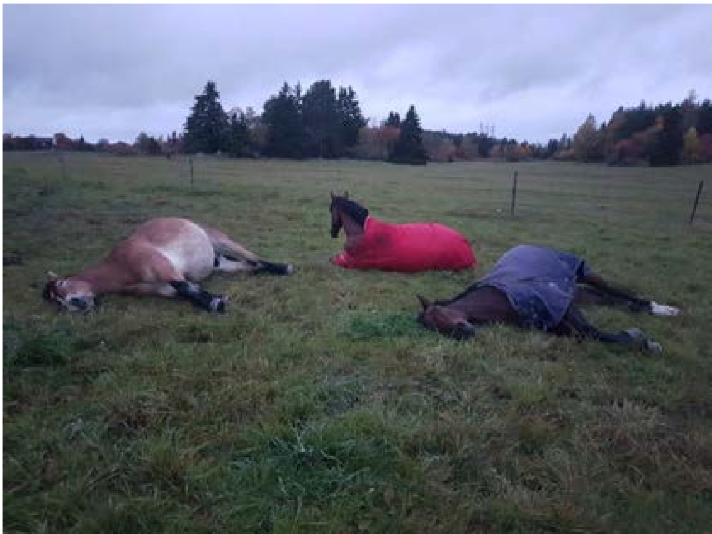
Figur 7. Längre vegetationsperiod med milda vårar och höstar kan ge djuren en längre betesperiod.

ningsmål och aktiviteter enligt generella rutiner för verksamhetsplaneringen. Vidare görs en viss kvantitativ uppföljning av antal publicerade vetenskapliga artiklar, pågående forskningsprojekt och nya samarbeten där klimatanpassning ingår. Likaså kan mätas antal läsare på SVA:s websidor och på SVA:s inlägg på sociala medier inom området. Vidare pågår att utveckla SVA:s interna FoU-katalog så att projekt redan vid ansökan öronmärks hur de relaterar till klimatanpassning och Agenda 2030-målen och att en sammanställning av detta kan göras. Antal kurser, seminarier, konferenser, m.m. där SVA sprider kunskap om klimatanpassning kan registreras i en intern databas för kunskapsstöd och kommunikation och ”taggas” så att det framgår att det är aktiviteter relaterade till klimatanpassning.