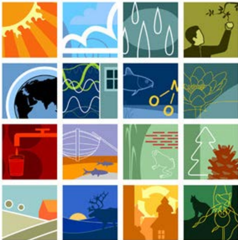
Figur 3. De 16 miljö kvalitetsmålen visualiserade (18). Illustratör: Tobias Flygare.