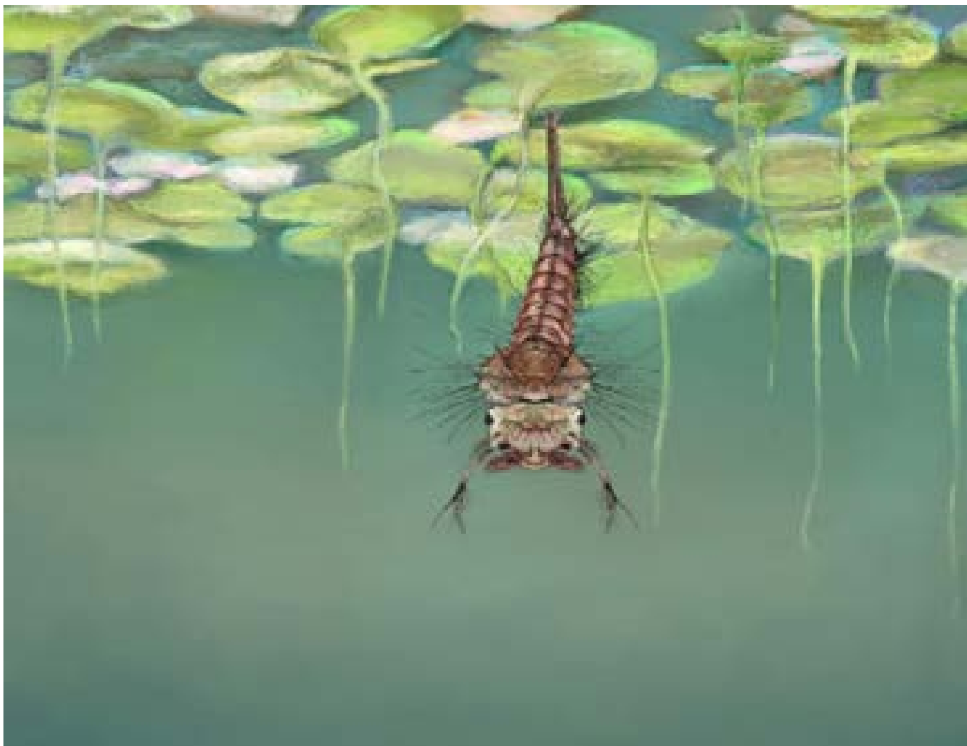
Figur 5. En mygglarv i vatten. Ett förändrat klimat påverkar insektsvektorernas ekologi. Längre, varmare säsonger gör att arter sprids norrut och kan även ge tätare populationer samt öka risken för spridning av smittor. Illustration av Disa Eklöf.

SVA ansvarar för mikrobiologisk och epidemiologisk övervakning av de vatten-, livsmedels- och vektorburna djursjukdomar som är anmälningspliktiga. De smittämnen som orsakar dessa sjukdomar kan förekomma i Sverige eller föras hit vid internationell handel och transport av djur och djurprodukter eller med vilda djur, fåglar och vektorer. Vid sjukdomsutbrott utför SVA utredningar i samarbete med Jordbruksverket men även med regionala smittskyddsenheter och andra centrala myndigheter såsom Livsmedelsverket och Folkhälsomyndigheten, och i vissa fall även med Naturvårdsverket och Havs- och vattenmyndigheten. SVA utför också diagnostik av många ”klimatkänsliga” smittämnen.