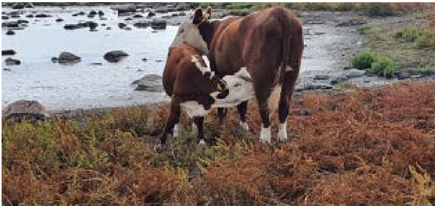
Figur 1. Under torrperioder och vattenbrist kan det vara problem med att förse djuren med dricksvatten av god kvalitet. Ytvatten kan vara förorenat och därmed olämpligt som dricksvatten till betesdjur.