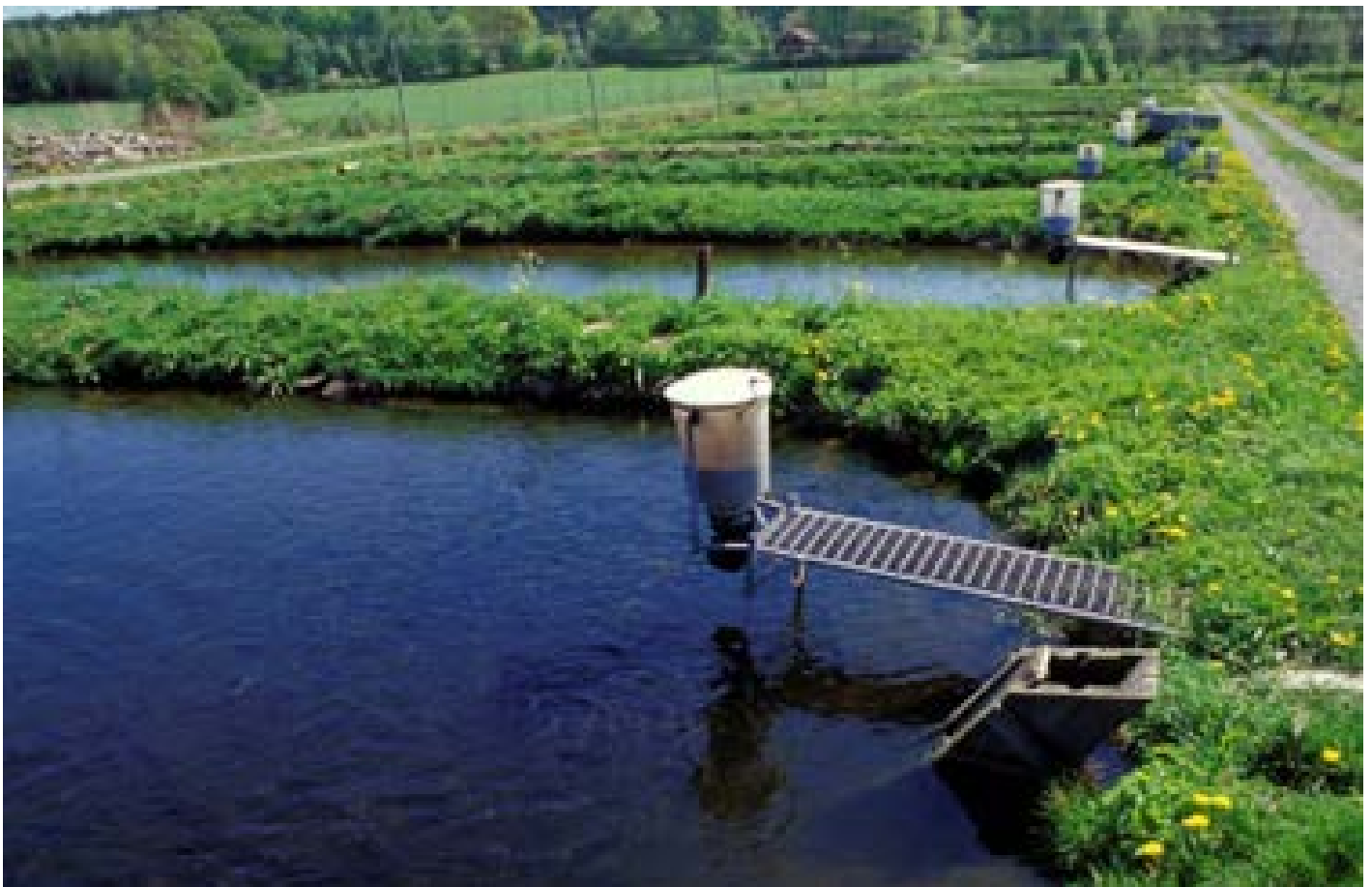
Figur 6. Fiskodling i jorddammar är mycket utsatta för extremväder såsom värmeböljor, skyfall/översvämningar och torka/vattenbrist.

SVA behöver också ha ett löpande utbyte med nationella och internationella aktörer, såsom att ingå i Myndighetsnätverket för klimatanpassning och att delta i arbetet med IPCC. Även andra aktörer