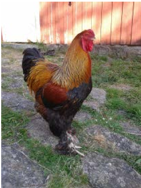
Figur 4. Smittriskerna kan komma att öka av ett förändrat klimat, vilket kan komma att i perioder begränsa djurens möjlighet till utevistelse.